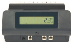
Die Rückansicht der ER-230 mit den Schnittstellen für Netzanschluss, Schublade und den beiden seriellen Schnittstellen